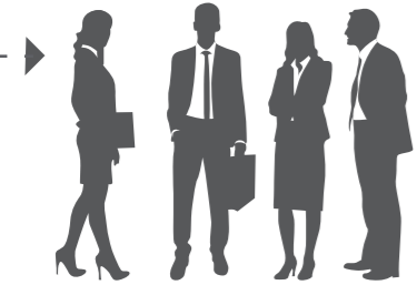
Rekrutierung der Mentor:innen, Ausbau Karrierenetzwerk